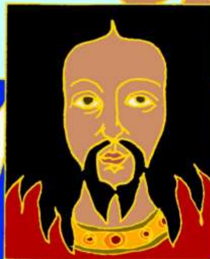
(Jan van Eyck 1438-40)