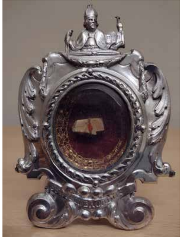
Foto: Zilveren reliëkhouders met een relik van de H. Willibrordus. Gemaakt in 1778. Wordt bewaard in de Willibrorduskerk.